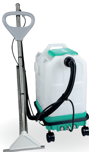
INJECTEUR EXTRACTEUR 24L