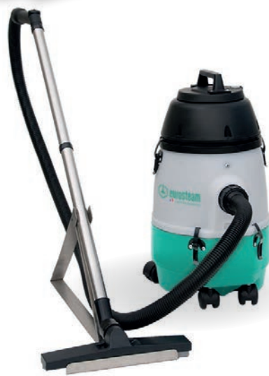
ASPIRATEUR POUSSIÈRE À BATTERIE 12L