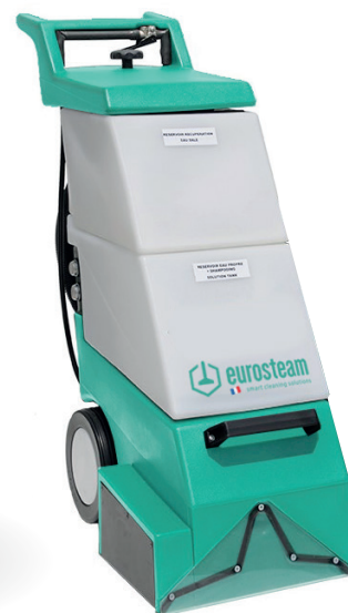
AUTOLAVEUSE MOQUETTE COMPACT 15