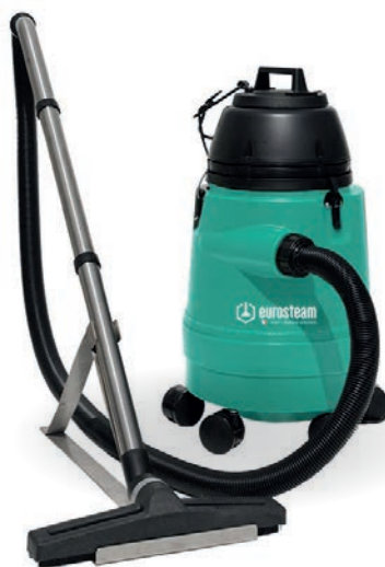
ASPIRATEUR TORNADE 25L