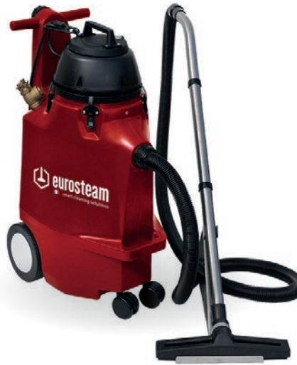
ASPIRATEUR SPÉCIAL INONDATION