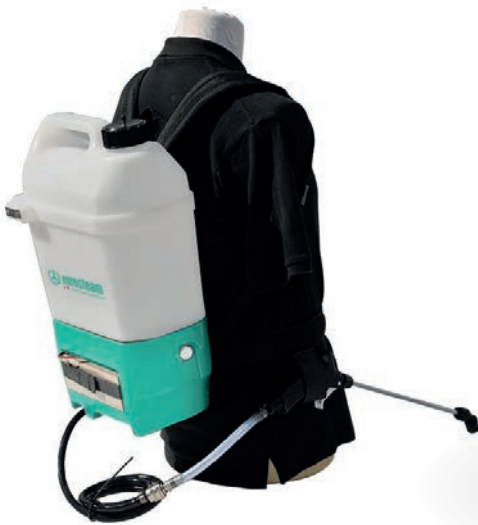
PULVÉRISATEUR DORSAL 14L