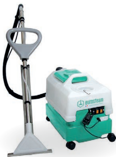
INJECTEUR EXTRACTEUR 9L