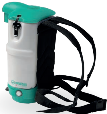
ASPIRATEUR DORSAL 128AD