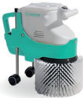
BROSSE ESCALIERS 270TRS/MIN

BRUSHING, SPRAYING AND POLISHING ROUTINE CLEANING OF HARD FLOORS AND CARPETS