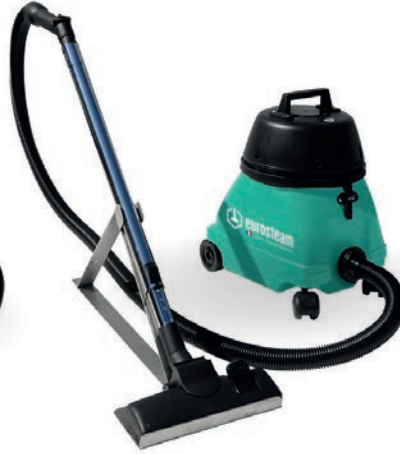
ASPIRATEUR POUSSIÈRE 13L