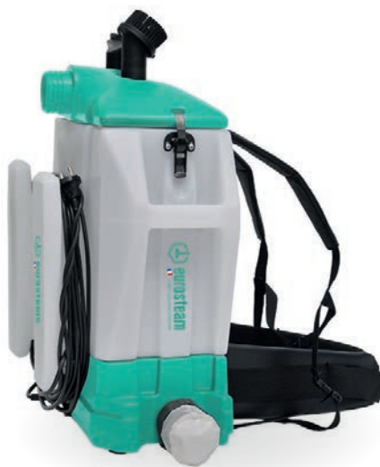
ASPIRATEUR SOUFFLEUR 10L