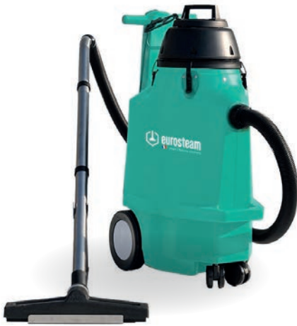
ASPIRATEUR EAU ET POUSSIÈRE 60L