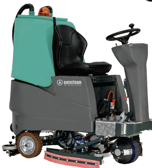
TOOLAV RO 750