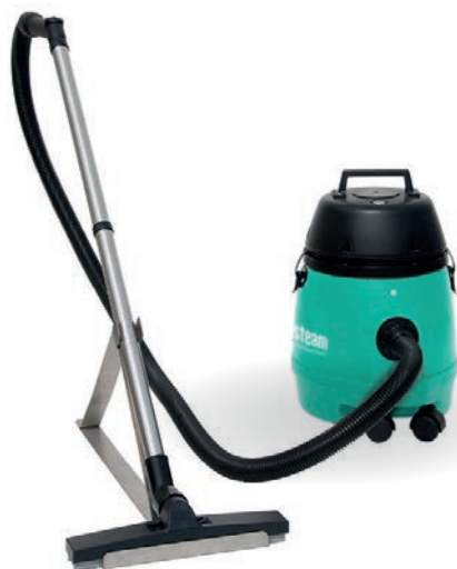
ASPIRATEUR EAU 12L