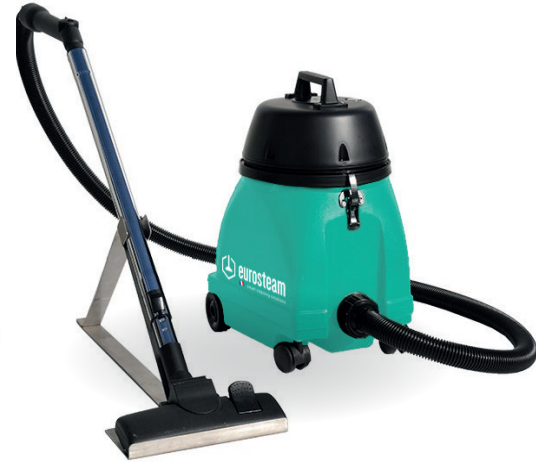
ASPIRATEUR POUSSIÈRE 16L