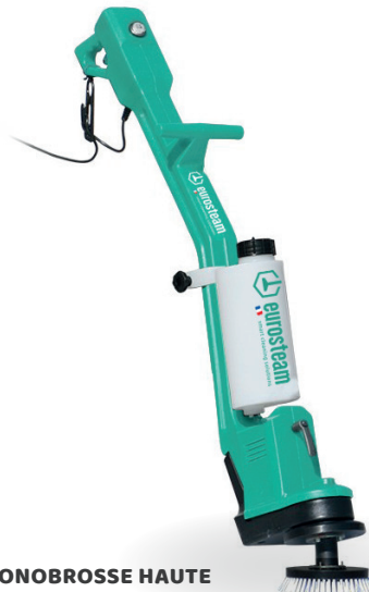
MINI-MONOBROSSE HAUTE 300TRS/MIN