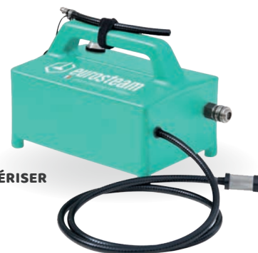
BOITE À PULVÉRISER