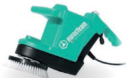
MINI-MONOBROSSE BASSE 300TRS/MIN