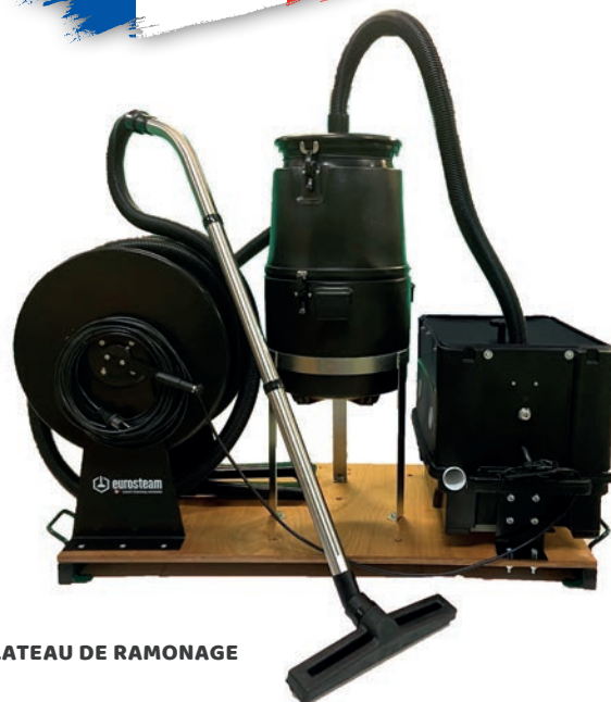
PLATEAU DE RAMONAGE