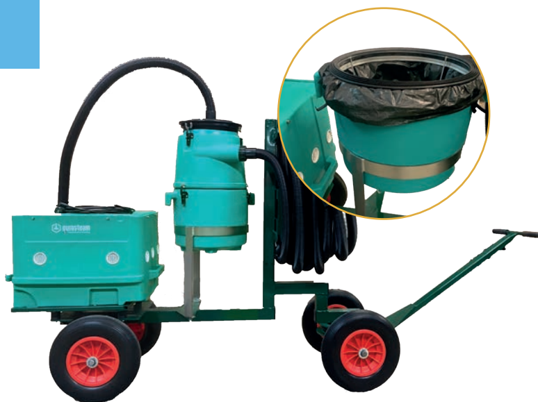
CENTRALE D'ASPIRATION POUSSIÈRE