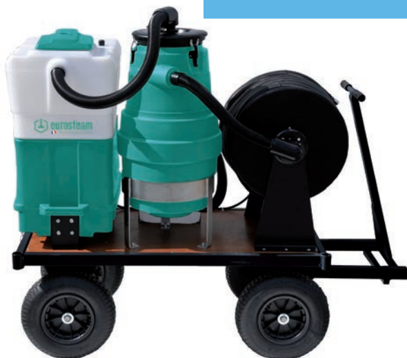
CENTRALE DE QUAIS ASPIRATION - INJECTION/EXTRACTION