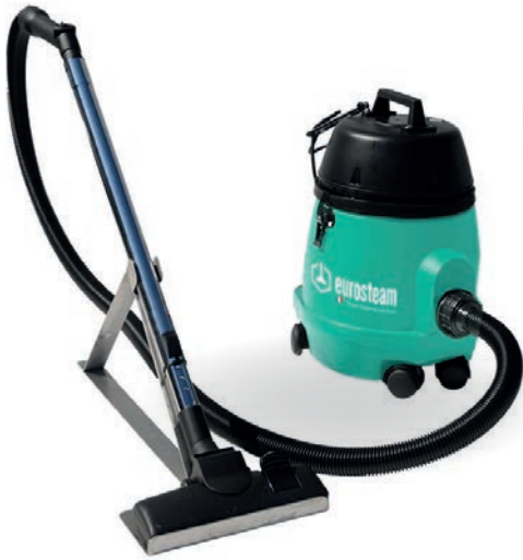
ASPIRATEUR POUSSIÈRE 12L