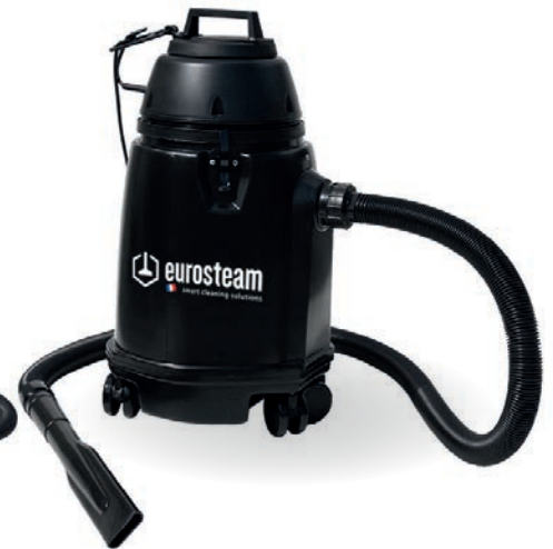
ASPIRATEUR SPÉCIAL RAMONAGE

Our wide range of vacuum cleaners allows us to offer you different products that meet your needs especially in terms of capacity (until 60L), function (dry, wet or specific for some activities as aeronautic, railway, flood or chimney sweeping) power (800 to 1300 watts) or preference (electric cable, battery, with or without paper bag / textile bag, with casters or backpack vacuum).