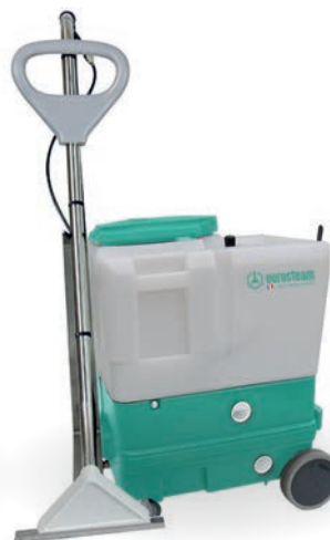
INJECTEUR EXTRACTEUR 53L